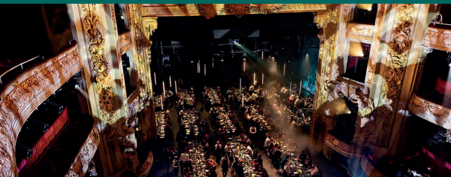
Cérémonie des TheFork Awards - 13 novembre 2023 - Opéra de Lille

TheFork Awards - le 1 er prix food 100 % digital décerné par le grand public - est de retour pour une édition plus festive que jamais ! Le cru 2024 sera notamment marqué par les 5 ans de cet événement national mettant en lumière la nouvelle génération de chefs en France. Comme pour les éditions précédentes, le principe reste inchangé : découvrir et soutenir de jeunes chefs venant d'ouvrir ou de reprendre un restaurant en France, en votant pour sa table préférée jusqu'au 30 septembre sur le site internet dédié. Pas de jury composé de professionnels, le grand public est l'unique décisionnaire. Pour participer, les nommés sont au préalable recommandés et parrainés par des grands chef(fe)s de la gastronomie française. Cette année, la cérémonie de remise de prix se déroulera à Paris et anniversaire oblige, la fête s'annonce grandiose !